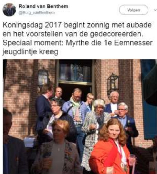
11.05 - 27 apr. 2017 vanuit Eemnes, Nederland